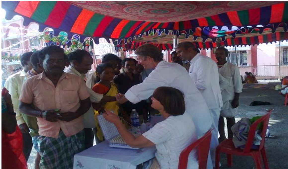
Campo Medico 21-23 Novembre 2012 alla Stazione Ferroviaria di PN, Puttaparthi