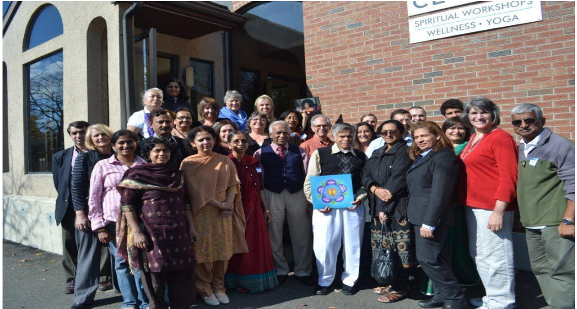
Corso di addestramento JVP 20-21 Ottobre 2012 ad Hartford CT USA